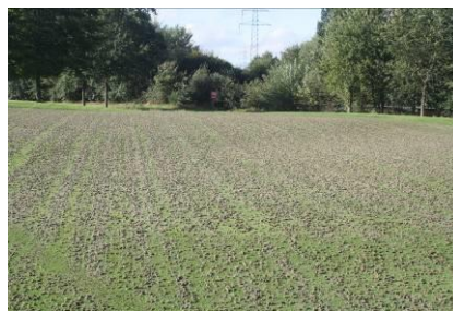
Grün 1 mit ausgeworfenen Cores