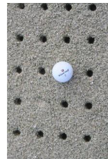
Größe der Löcher vor dem Einschleppen des Sandes