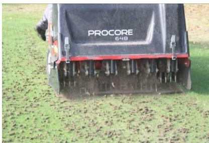
Aerifizieren mit Hohlspoons

Die wirkungsvollste Methode ist das Aerifizieren mit Hohlspoons. Genau diese Methode haben wir heute durchgeführt. Es wurden dicke Pfropfen (Cores) aus dem Boden gestochen. Danach wurden die Löcher wieder mit Sand geschlossen. Gleichzeitig erfolgt eine großflächige Nachsaat auf den Grüns.