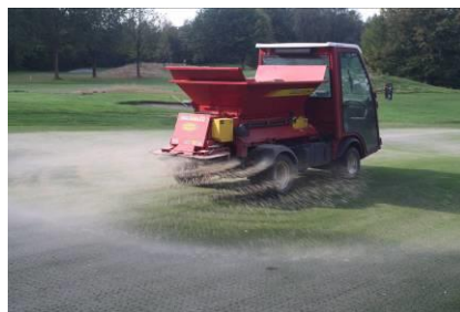
Grün wird besandet