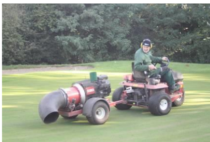
Grün wird abgeblasen