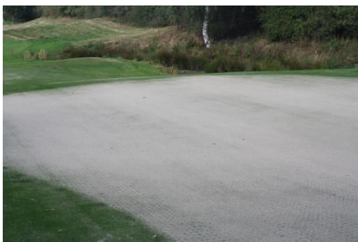
Grün vollständig besandet